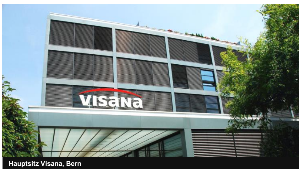
Hauptsitz Visana, Bern