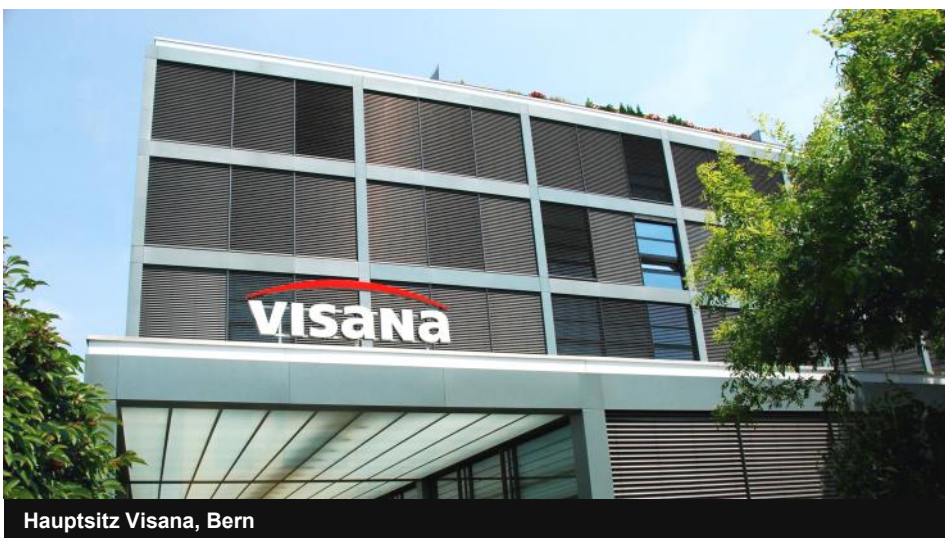
Hauptsitz Visana, Bern